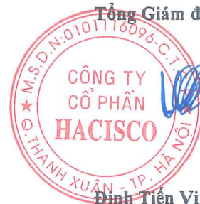
Đình Tiên Vịnh