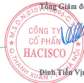
Đình Tiên Vịnh